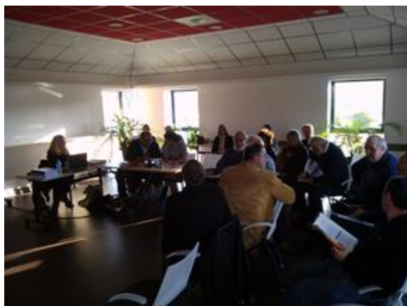
Rencontre EPCI Isle Loue Auvézère – 5 décembre 2017

Un important travail de compilation, d'analyse et de mise en forme de la consultation territoriale a été mené au cours du 1 er semestre 2018 afin de formaliser les attentes des acteurs locaux. Ces analyses ont permis d'alimenter le travail du groupe technique d'élaboration du SAGE afin d'élaborer un document synthétisant les objectifs et leviers d'actions formant une version de travail de la stratégie pour le SAGE.