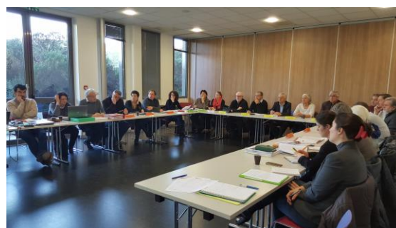
Réunion du bureau le 23 janvier 2017 à Coulounièx Chamiers (24)

Lors de la réunion du 6 juin 2017, le bureau a pris connaissance du scénario tendanciel pour le territoire Isle Dronne. Un point a également été fait sur le travail du groupe thématique « Eau et agriculture ».