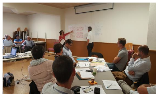
Réunion thématique « Inondation » – 29 juin 2017

Suite à une présentation de l'état initial, du diagnostic et des tendances d'évolution, les participants ont été invités à remplir des fiches « objectifs et leviers d'actions ». Ces attentes ont été synthétisées par atelier et présentées à l'assemblée afin de nourrir les échanges collectifs.