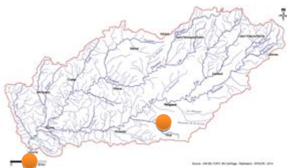
Réunions thématiques du SAGE Isle Dronne

Organisées sur deux journées les 29 juin et 4 juillet, elles ont réuni une cinquantaine de participants, qui ont travaillé sous la forme d'ateliers (organisation par tables d'une dizaine d'acteurs).