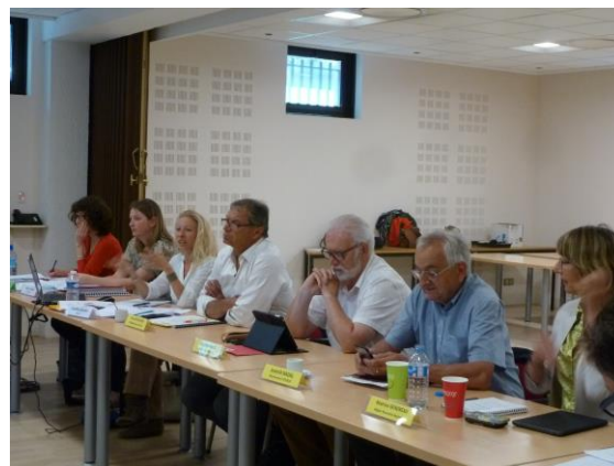
Réunion du bureau le 6 juin 2017 à Périgueux (24)

La réunion du 27 novembre 2017 a permis de faire un point sur les commissions thématiques chargées de travailler sur la stratégie du SAGE qui se sont tenues aux mois de juin et juillet 2017 et d'échanger sur les premiers éléments de la synthèse des objectifs et leviers associés. Le bureau a validé les étapes de travail d'élaboration de la stratégie.