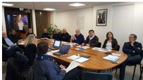
Rencontre EPCI Lubersac-Pompadour – 29 novembre 2017

Ainsi, entre les mois de novembre et décembre 2017, une soixantaine d'élus a été rencontré dans les communautés de communes Isle Double Landais, Isle Vern Salembre en Périgord, Isle et Crempse en Périgord, Isle Loue Auvézère, Lubersac Pompadour, Pays de Saint-Aulaye, Pays du Ribéracois, Dronne et Belle et Lanouaille. Ces temps d'échange ont permis de partager avec les élus les différents travaux réalisés dans le cadre de l'élaboration avec une déclinaison de l'état des lieux à leur échelle et de les interroger sur leurs préoccupations, leurs objectifs prioritaires et les leviers d'actions envisageables pour chaque collectivité.