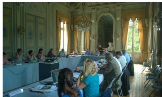
Réunion du bureau le 21 juin 2016 à Périgueux (24)

consultés sur le projet de diagnostic durant l'été, et que tous les membres de la CLE seraient consultés par la suite pour donner leur avis sur le projet de diagnostic.